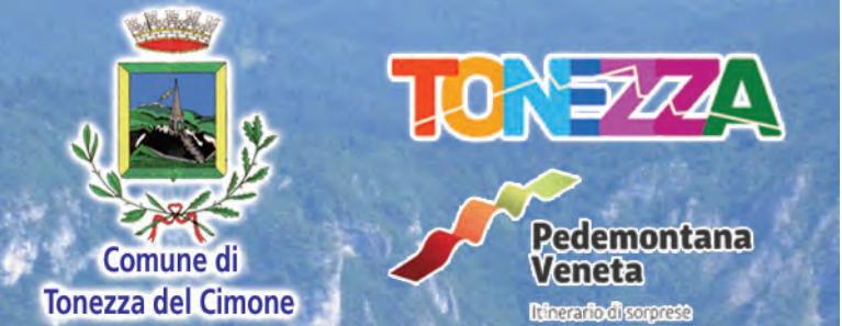
Foto di copertina: Tonezza del Cimone di Luciano Busato • Stampa: Stab. Tip. FUGA - Arsiero